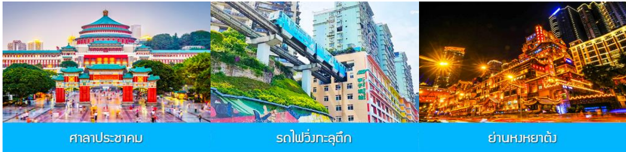
ศาลาประชาชน

พักที่ MOUNTAIN VIEW HOTEL โรงแรมระดับ 4 ดาวหรือเทียบเท่าในเมืองอู่หลง