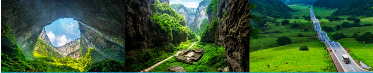
อุทยานหลุมฟ้า

พักที่ HOLIDAY INN EXPRESS HOTEL โรงแรมระดับ 4 ดาวหรือเทียบเท่าในเมืองจงชิ่ง