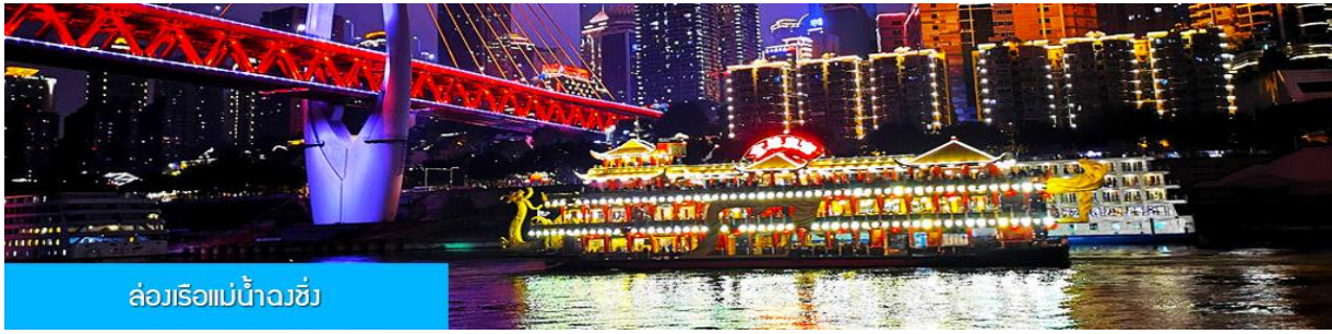
ล่องเรือแม่น้ำจางซี