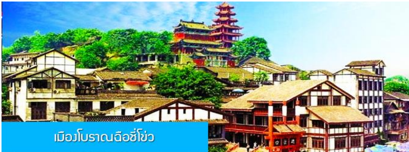
เมืองโบราณฉือซีโจว

พักที่ HOLIDAY INN EXPRESS HOTEL โรงแรมระดับ 4 ดาวหรือเทียบเท่าในเมืองฉงชิ่ง